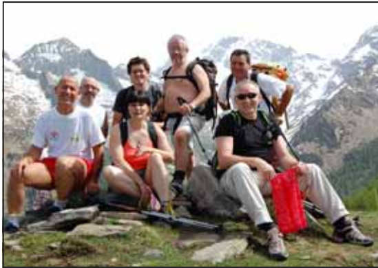
Alpe Scermdone m 2.103