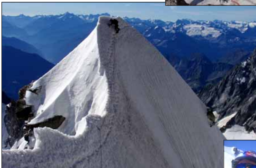
Gigi sul traverso della "pinna di pescecane" sulla via Kuffner al Mount Maudit m 4.465, salita in coppia con zio Enry.