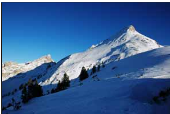
Veduta verso il Col Becchei

Dal Rifugio Fanes alle auto Tempo previsto ore 1.00 - 1.30