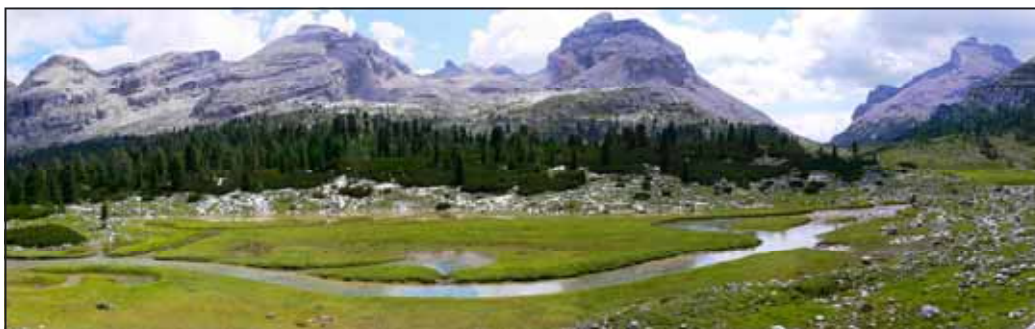
Alpe di Fanes

L'altipiano di Fanes è uno dei luoghi più incantevoli delle Dolomiti, il Col Becchei è considerato la cima con il panorama più vasto del Gruppo di Fanes.