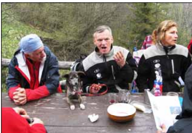
A tavola con gli amici