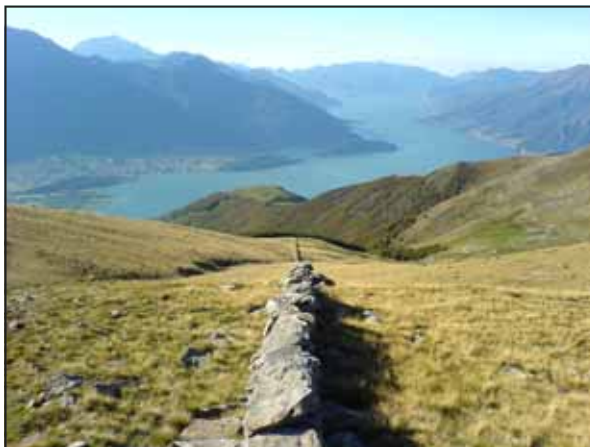
"Termerone" con vista lago, salendo al Sasso Canale