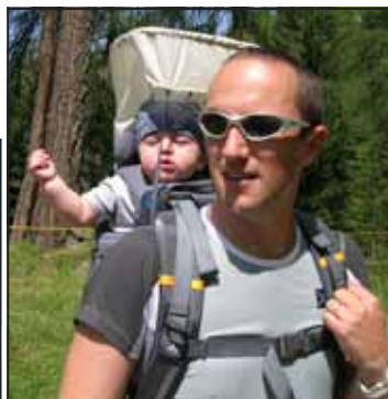
Alessandro il nuovo "falchetto"