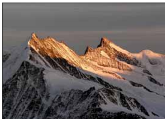
A destra il Gross-Grunhorn