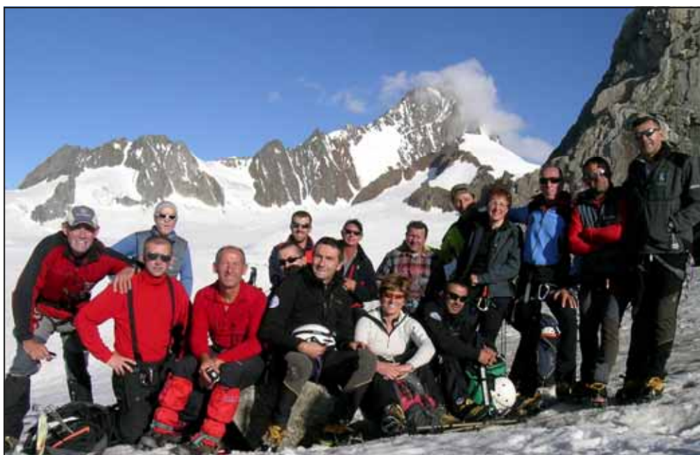
14 partecipanti con alle spalle la vetta del Finsteraarhorn

Abbiamo "goduto" nelle nostre gambe il leggendario isolamento che ha reso famose le cime dell'Oberland Bernese. E' stata grande la gioia nel conquistare tutti insieme la cima.