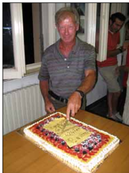
In sede si festeggia la cima