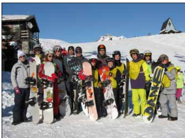
Immagini dai corsi 2010