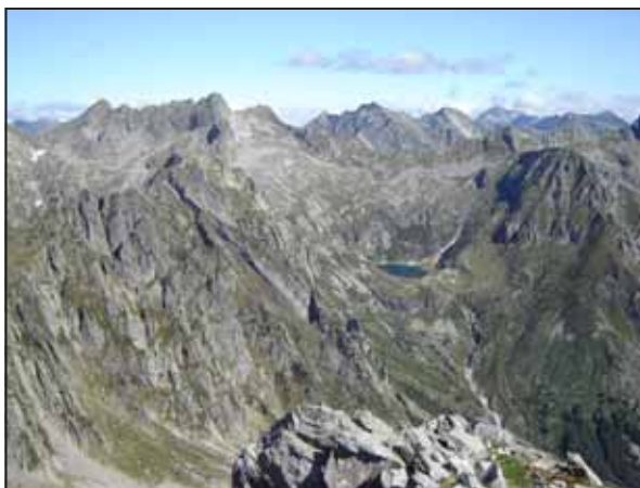
Testata della Val Darengo con l'omonimo Lago