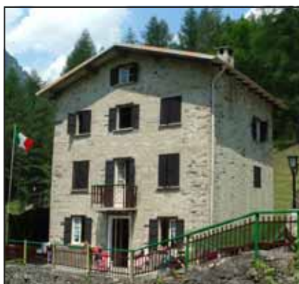
Il Rifugio GEFO

Invernale (da dicembre a marzo) Euro 9,00