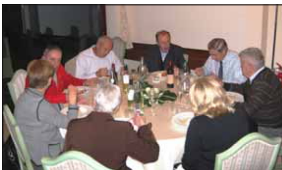
Immagini della Cena Sociale 2009