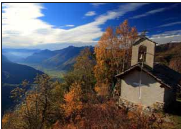
Panorama da Agoncio

ATTENZIONE! tutte le proposte sono riservate ai Soci in regola con il tesseramento 2010