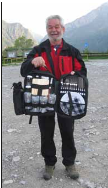
Passo del Fo'