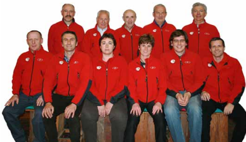
I Consiglieri per il biennio 2009 - 2010