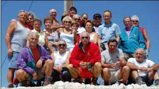
In vetta al Picco di Vallandro