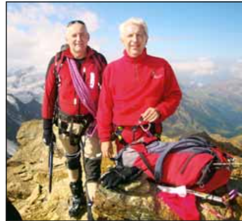
Monte Cevedale m 3.769