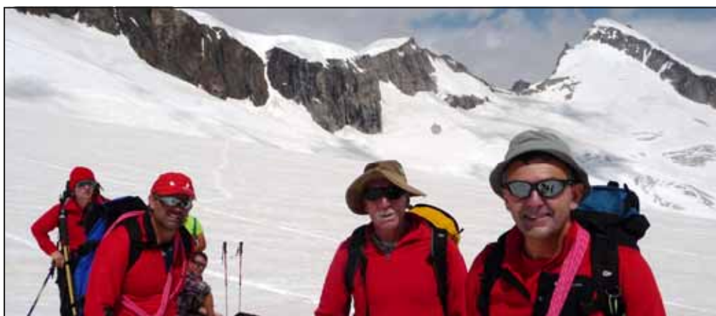
4 "peones" sul ghiacciaio durante il lunghissimo avvicinamento al rifugio