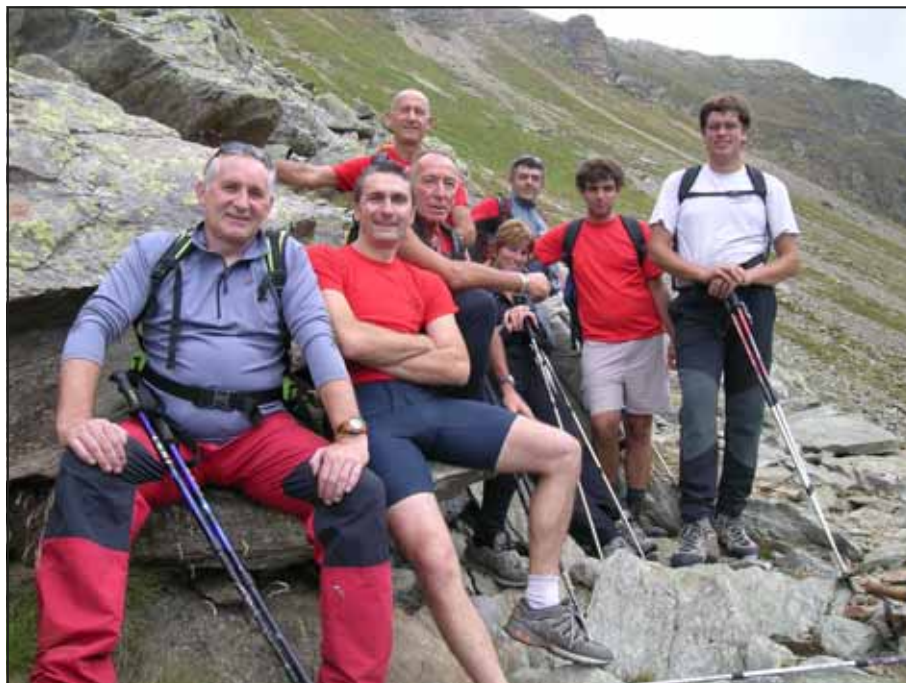
Gita al Pizzo Combolo in Val Fontana