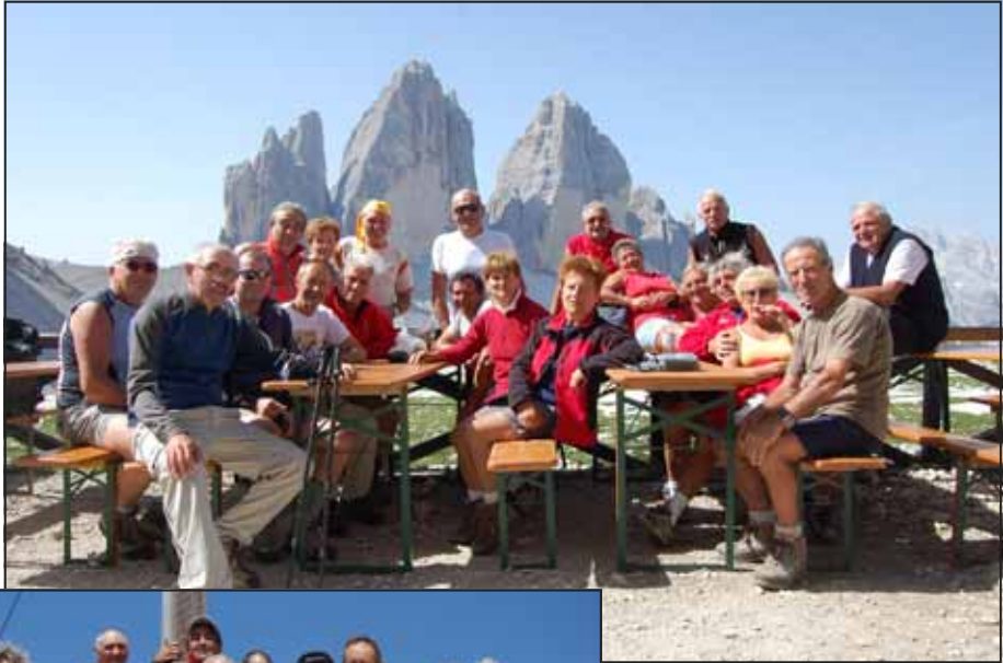
Rif. Locatelli alle Tre Cime di Lavaredo