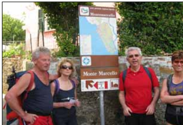
Bocche di Magra - Lerici