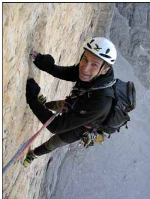
Oscar sulla via dei Sassoni alla Grande di Lavaredo.