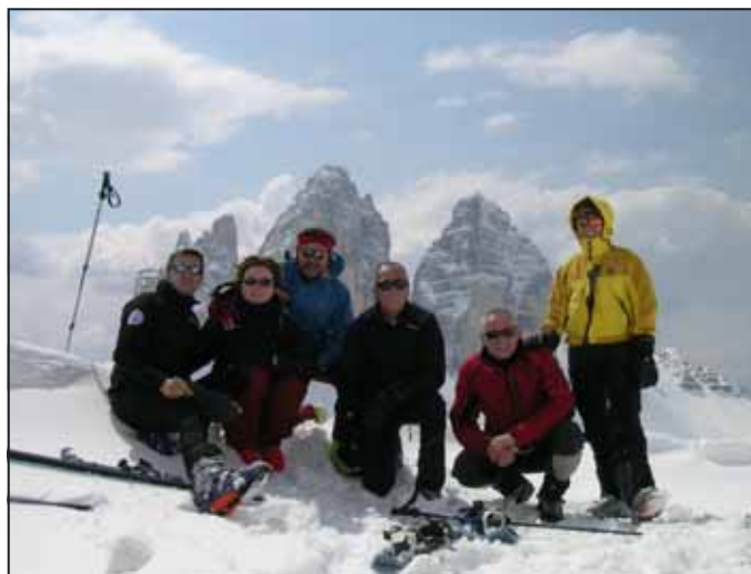
Scialpinismo alle Tre Cime di Lavaredo in vetta al Sasso di Sesto